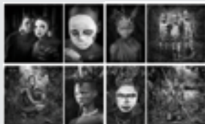
FOTO: El autor de la portada es José Beut, ganador de la XXXVII edición del concurso nacional de fotografía Sarthou Carreres.