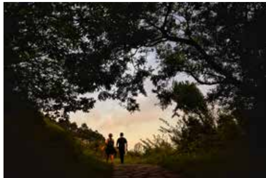
3º Premio Joan Julbe