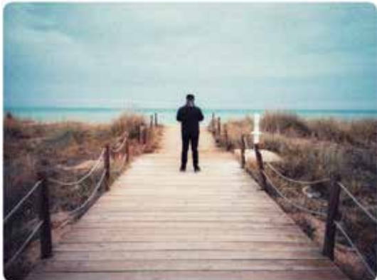
2º Premio Anna Arayo