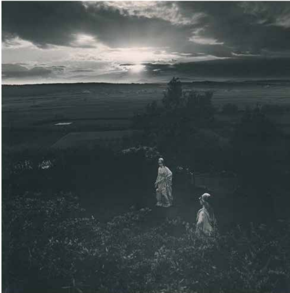
1984 primer premio Servando Carmona