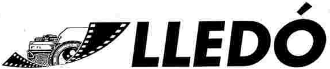
FOTO - VIDEO - IMAGEN DIGITAL

TODO EN FOTOGRAFIA I VIDEO-MATERIAL PROFESIONAL REVELAMOS SUS FOTOS Y DIAPOSITIVAS EN UNA HORA AMPLIACIONES FOTOGRAFICAS HASTA 30X45 EN UNA HORA