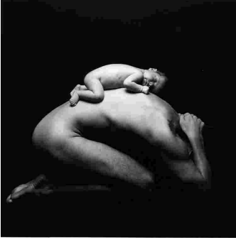
EDITA: Agrupació Fotogràfica Sarthou Carreres C.I.F. G- 12094801