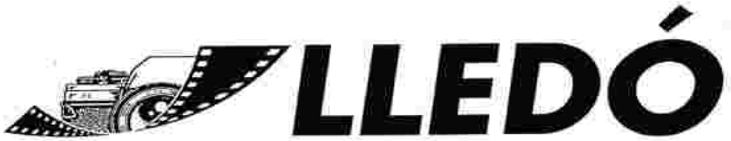
FOTO - VIDEO - IMAGEN DIGITAL

TODO EN FOTOGRAFIA I VIDEO-MATERIAL PROFESIONAL REVELAMOS SUS FOTOS Y DIAPOSITIVAS EN UNA HORA AMPLIACIONES FOTOGRAFICAS HASTA 30X45 EN UNA HORA