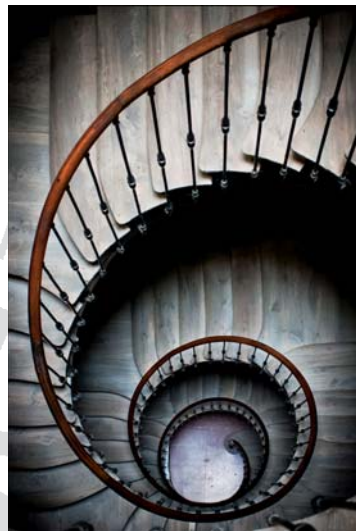
PRIMER PREMIO Carlos Amiguet "s/t"