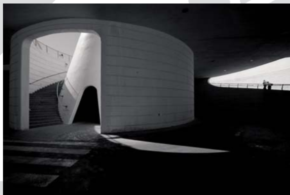
TERCER PREMIO Xavir Ferrer "s/t"