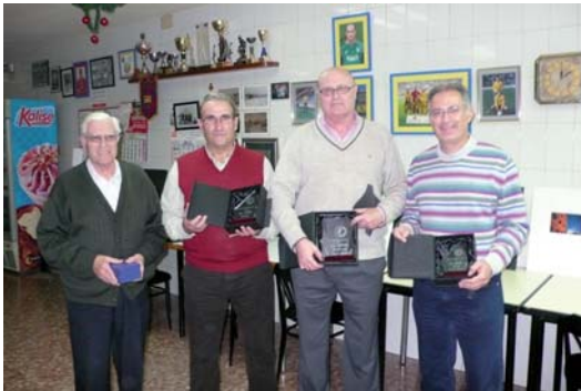
Ganadores Liguilla Anual 2010