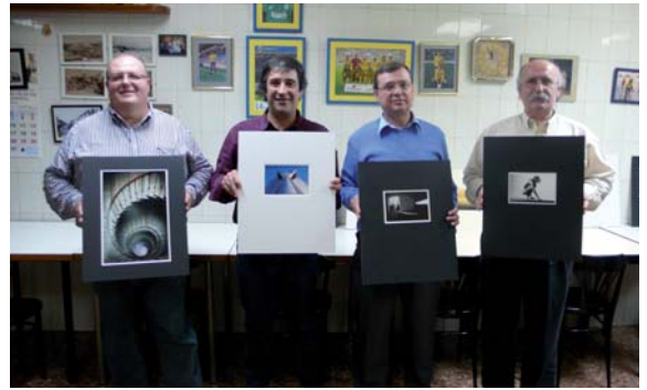
Ganadores Concurso Social 2010