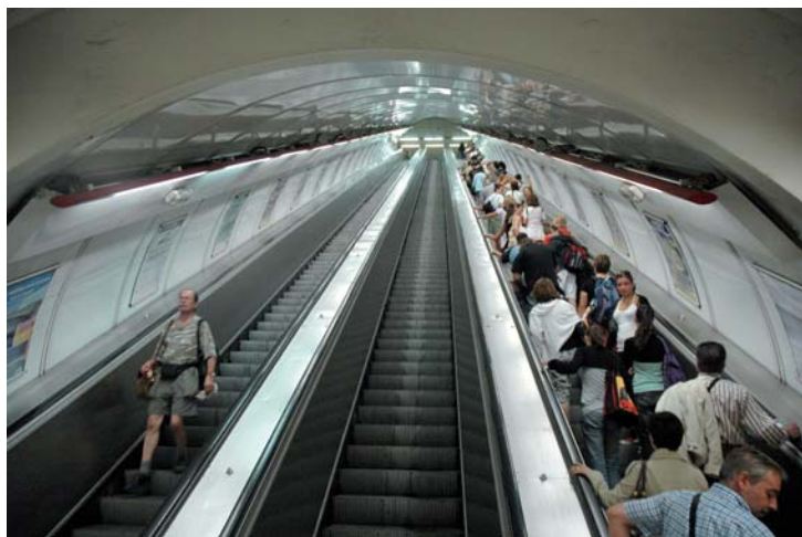
Metro del Este