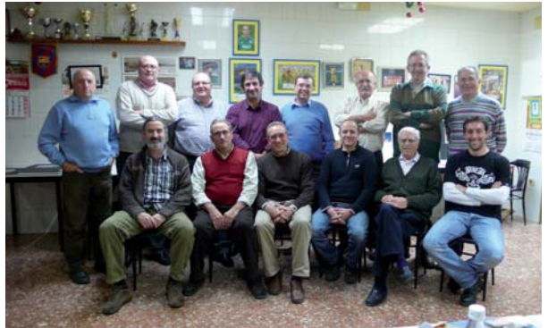
Miembros asociación asistentes a la cena de Na- vidad en el Hostal Sant Joan