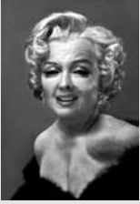
FOTO: El físico y fotógrafo Andrzej Dragan ha realizado un interesante experimento de manipulación fotográfica para un trabajo publicitario; utilizando un software y técnicas especiales, Dragan logra efectos sorprendentes y responde a una pregunta que se antoja necrófila, ¿como luciría Marilyn Monroe en el 2013?.