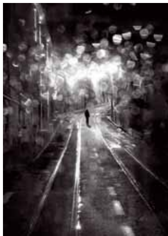
Tercer puesto: Inés Gil (FCLV)